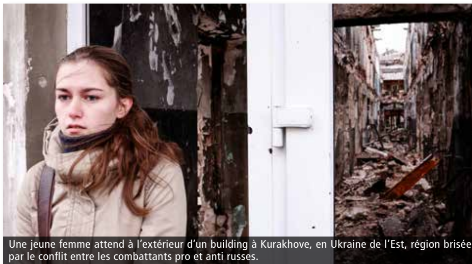
Une jeune femme attend à l'extérieur d'un building à Kurakhove, en Ukraine de l'Est, région brisée par le conflit entre les combattants pro et anti russes.