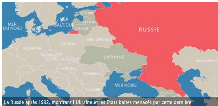
La Russie après 1992, montrant l'Ukraine et les États baltes menacés par cette dernière.